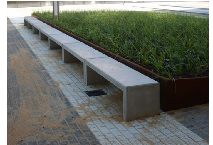
Zitelementen, om uit te rusten en/of voor laagdrempelige ontmoeting i.c.m. groen.