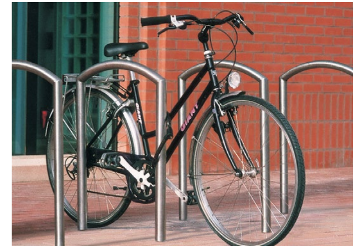
Fietsen parkeren in daarvoor bestemde beugels, nietjes, rekken o.i.d.