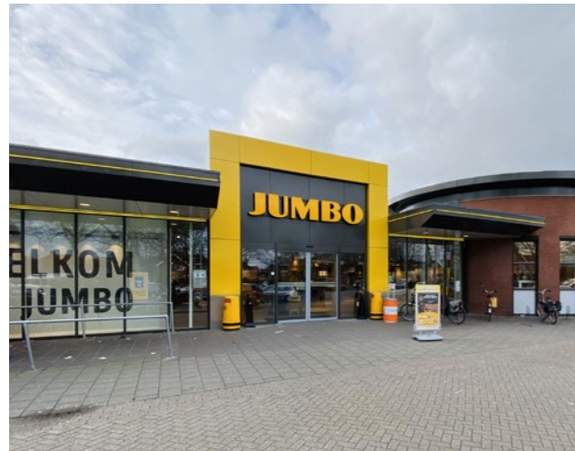
Één duidelijke hoofdentree