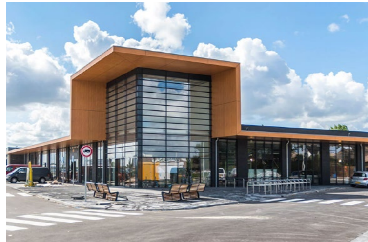
Gevel is één helder front.