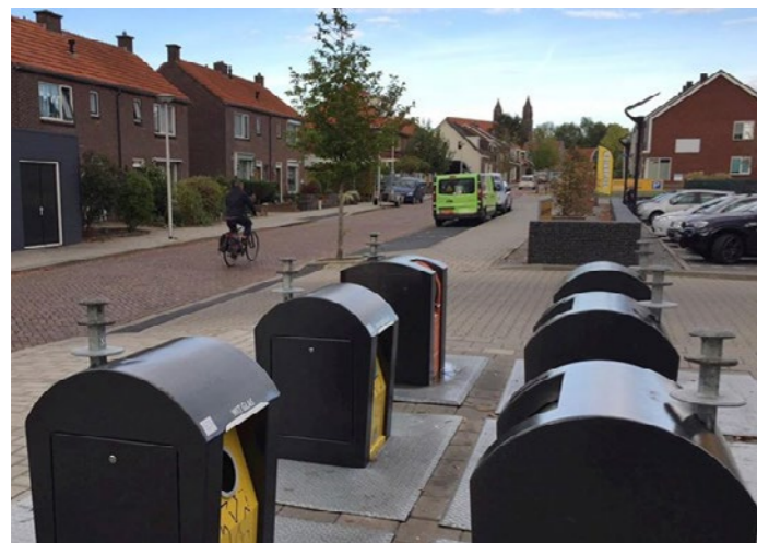
Verplaatsen milestraat wordt nader onderzocht. Dit levert meer ruimte op rondom de hoofdentree.