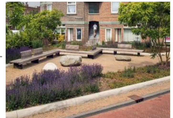
Bankjes rondom speelveld. Zicht op kinderen en laagdrempelige ontmoeting.

Jumbo Kuipers Oldenzaal Vlekkenplan verbeteren ruimtelijke kwaliteit