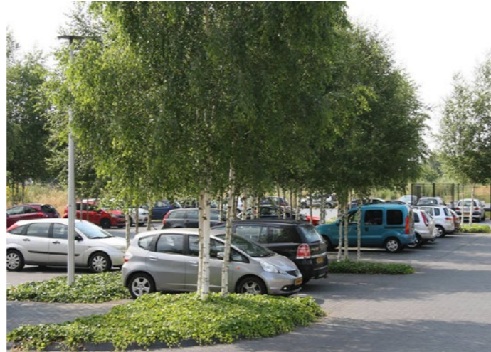
Groen tussen en rondom nieuwe parkeervakken.