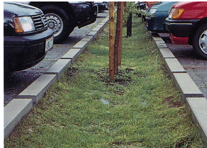
Groen tussen parkeervakken voor opvang water.