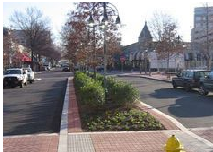
Groenstrook voor opvang water.