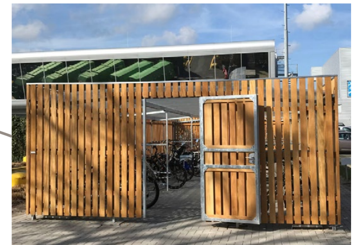
De medewerkers van de Jumbo krijgen eigen overdekte fietsenstalling. Dit maakt plekken vrij voor bezoekers.

Jumbo Kuipers Oldenzaal Vlekkenplan verbeteren ruimtelijke kwaliteit