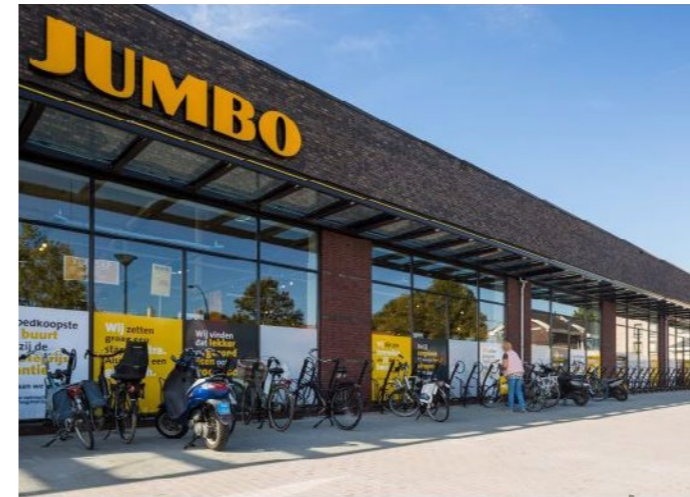
Fietsen bezoekers droog parkeren onder de luifel.