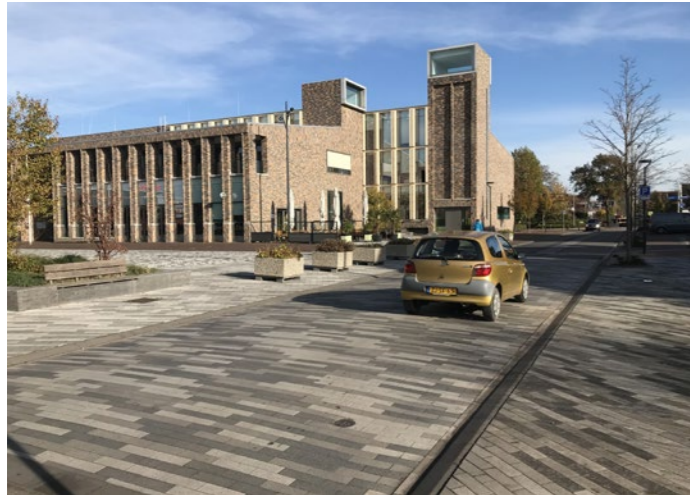
Type bestrating ondersteunt multifunctionele karakter van de ruimte; zowel verkeers- als ontmoetingsruimte.