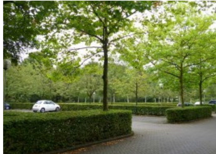
Groen tussen en rondom nieuwe parkeervakken.