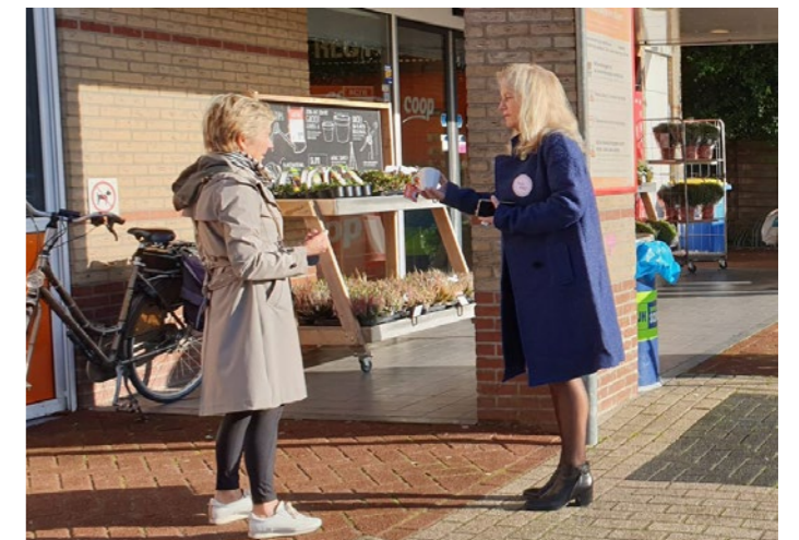
Elkaar ontmoeten op straat

Jumbo Kuipers Oldenzaal Vlekkenplan verbeteren ruimtelijke kwaliteit