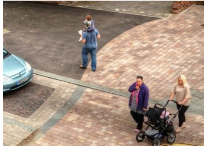
Fietsers en voetgangers zijn de baas. De auto is te gast.