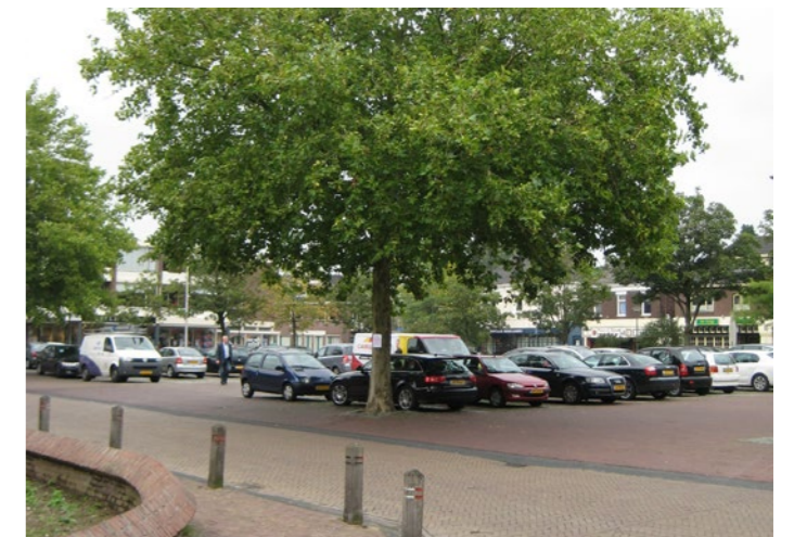
Bomen zoveel mogelijk behouden, draagt bij aan kwaliteit van de ruimte.