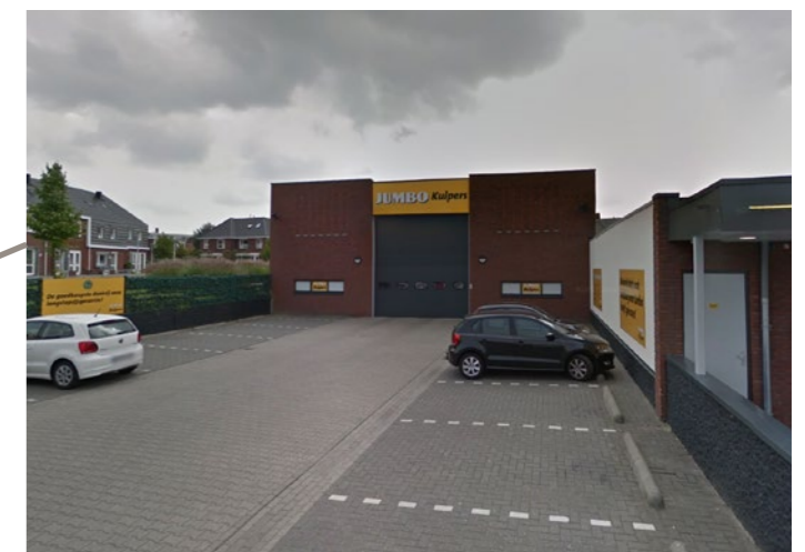
Mogelijke uitbreiding van laad-en los ruimte, ter verbetering van transport en beperken overlast buurt.