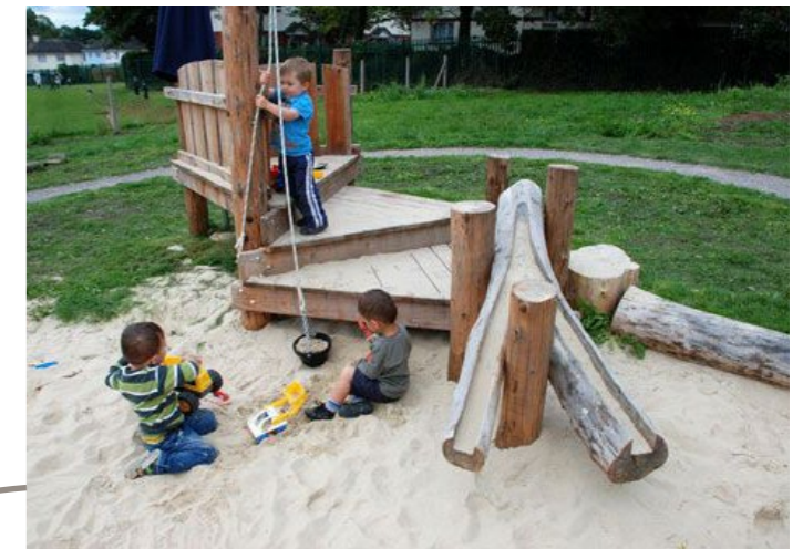
Natuurlijk inrichting speelveld t.b.v maximale waterdoorlatendheid groen.