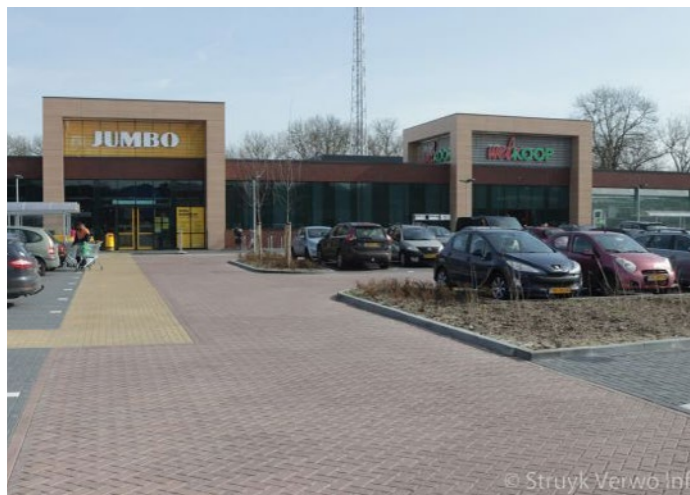
Parkeerplein met waterdoorlatende bestrating. Kleur is bestrating geeft ruimte voor voetgangers.