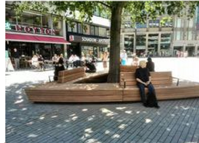
Straatmeubilair die ontspanning en ontmoeting stimuleert.