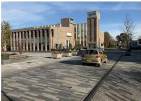
Type bestrating ondersteunt multifunctionele karakter van de ruimte; zowel verkeers- als ontmoetingsruimte.