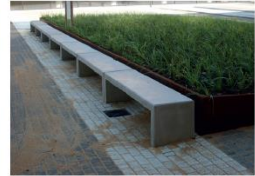
Zitelementen, om uit te rusten en/of voor laagdrempelige ontmoeting i.c.m. groen.