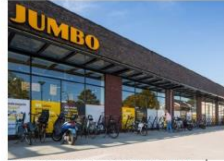
Fietsen bezoekers droog parkeren onder de luifel.