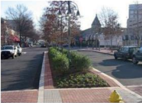
Groenstrook voor opvang water.