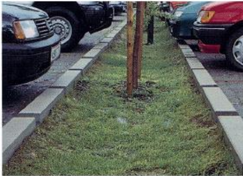
Groen tussen parkeervakken voor opvang water.