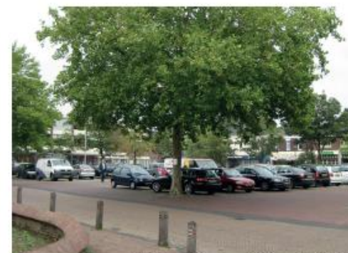
Bomen zoveel mogelijk behouden, draagt bij aan kwaliteit van de ruimte.