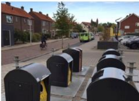
Verplaatsen mileustraat wordt nader onderzocht. Dit levert meer ruimte op rondom de hoofdentree.