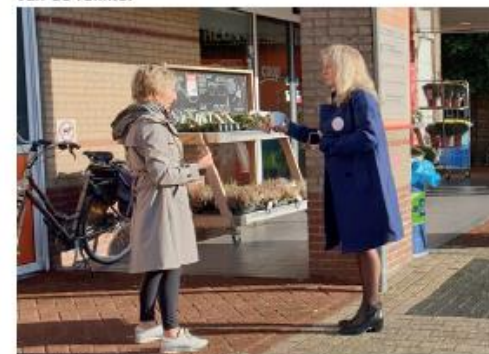
Elkaar ontmoeten op straat

Jumbo Kuipers Oldenzaal Vlekkenplan verbeteren ruimtelijke kwaliteit