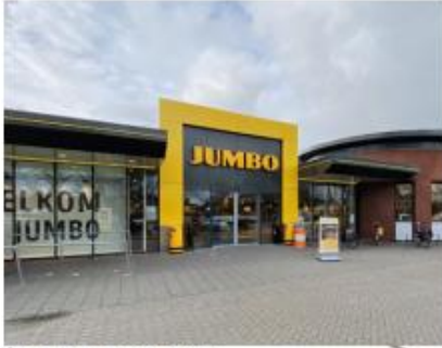
Eén duidelijke hoofdentree