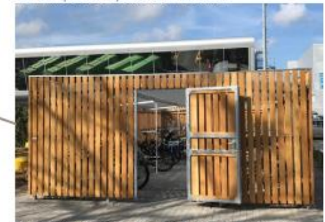
De medewerkers van de Jumbo krijgen eigen overdekte fietsenstalling. Dit maakt plekken vrij voor bezoekers.