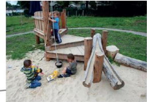
Natuurlijk inrichting speelveld t.b.v maximale waterdoorlatendheid groen.