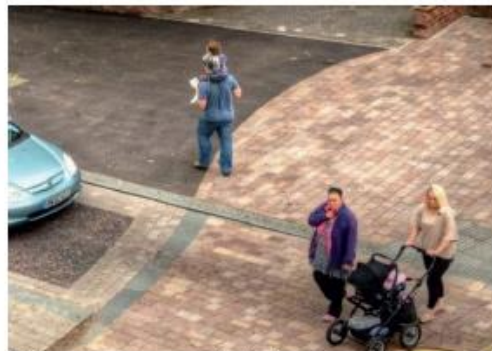
Fietsers en voetgangers zijn de baas. De auto is te gast.