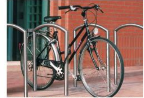
Fietsen parkeren in daarvoor bestemde beugels, nietjes, rekken o.i.d.