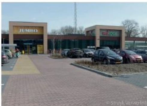
Parkeerplein met waterdoorlatende bestrating. Kleur is bestrating geeft ruimte voor voetgangers.