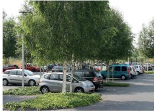
Groen tussen en rondom nieuwe parkeervakken.