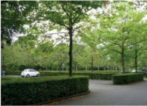
Groen tussen en rondom nieuwe parkeervakken.