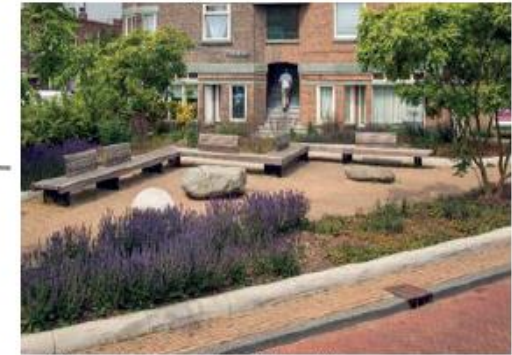
Bankjes rondom speelveld. Zicht op kinderen en laagdrempelige ontmoeting.