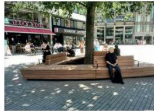
Straatmeubilair die ontspanning en ontmoeting stimuleert.