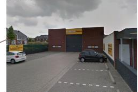
Mogelijke uitbreiding van laad-en los ruimte, ter verbetering van transport en beperken overlast buurt.