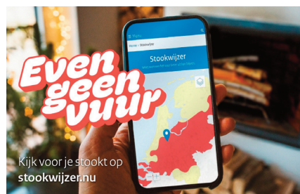
Kijk voor je stookt op stookwijzer.nu

Kijk op www.oldenzaal.nl/houtrook-en-gezondheid voor meer informatie en handige tips.