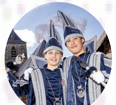
Daltonschool de Bongerd Prins Javier & Prins Stef

'Sepp en Tess bint favoriet, zo wordt carnaval ne mooie tied'